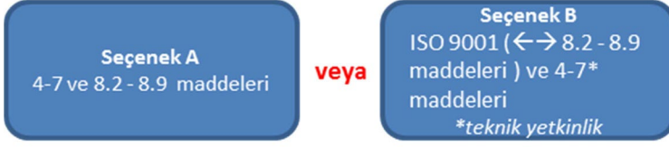
Şekil 2: Yönetim sistemi seçenekleri Ek B daha detaylı bilgi verir

İki yönetim sistemi seçeneği mevcuttur (bk. Şekil 2)