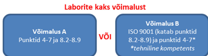
Joonis 2: Juhtimissüsteemi võimalused Põhjalikum seletus Lisas B

On kas võimalikku juhtimissüsteemi (Joonis 2) Võimalus A: Vastavus punktide sätetega 4-7 ja 8.2-8.9.