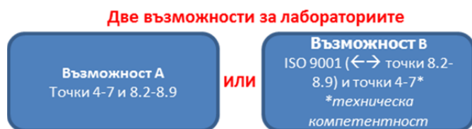
Фигура 2: Възможности за системата за управление Приложение В дава по-подробна информация

Има две възможности за системата за управление (виж Фиг. 2).